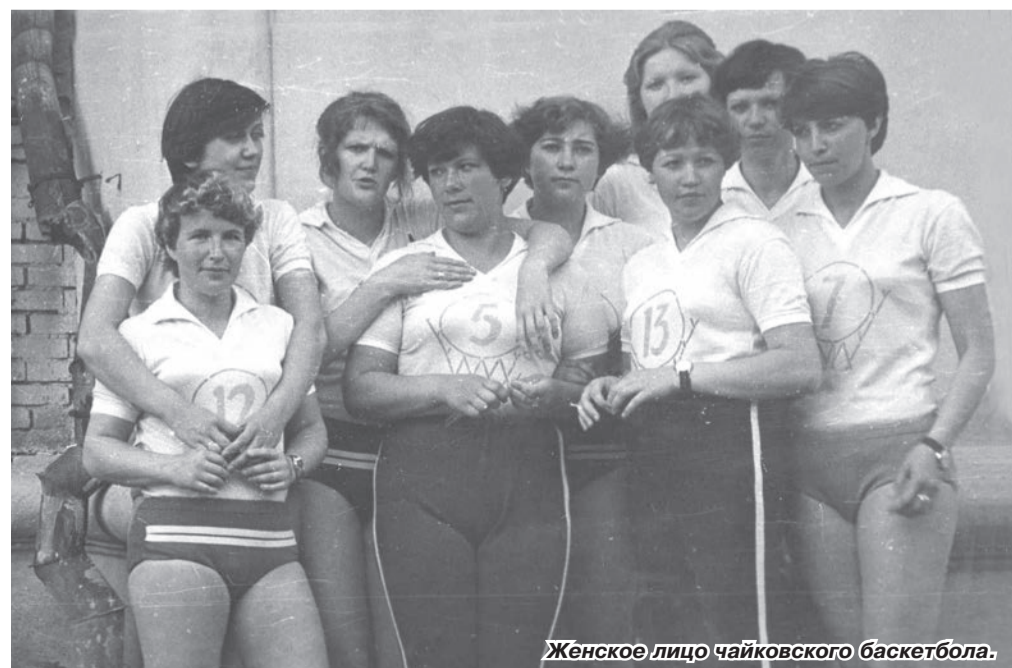
Женское лицо чайковского баскетбола.

На игры мы ездили на трамвае. Как-то, как раз перед нашей игрой, транспорта долго не было. Мы, пять человек, взяли такси и только-только успели на игру с командой из Закамска. Ребята против нас – все как на подбор, средний рост 190–195 см. Мы выигра-