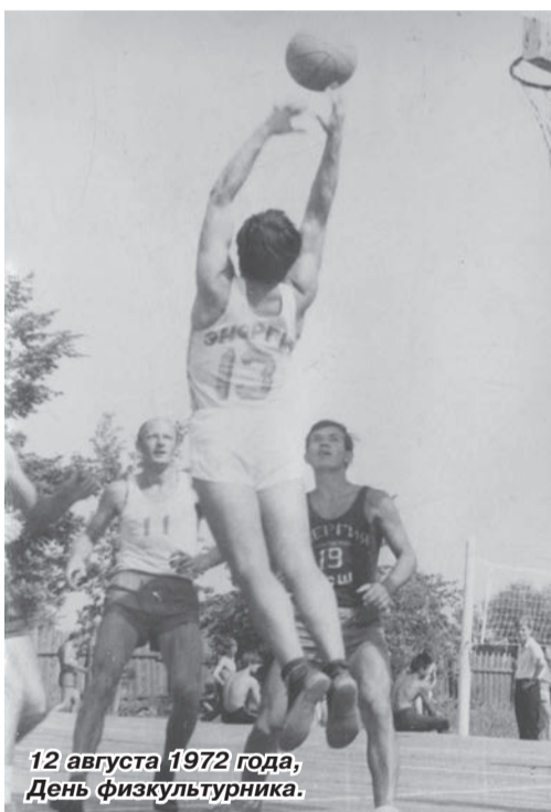
12 августа 1972 года, День физкультурника.

Поначалу условия для занятий были самыми простыми, если не сказать, примитивными: грунтовая площадка под открытым небом и кожаный мяч со шнуровкой. Форма тоже не поражала воображение: трусы, майка, кеды. Зимой занимались в спортзале школы №3 – лучше на то время. Его размеры составляли 9 на 18 метров при стандарте для баскетбольной площадки в 14 на 28 метров. Несмотря на такое несоответствие, мы с удовольствием занимались три раза в неделю, постигая азы баскетбола – чудесной игры, развивающей практически все природные качества человека: скорость, выносливость, прыгучесть, внимание, мышление.