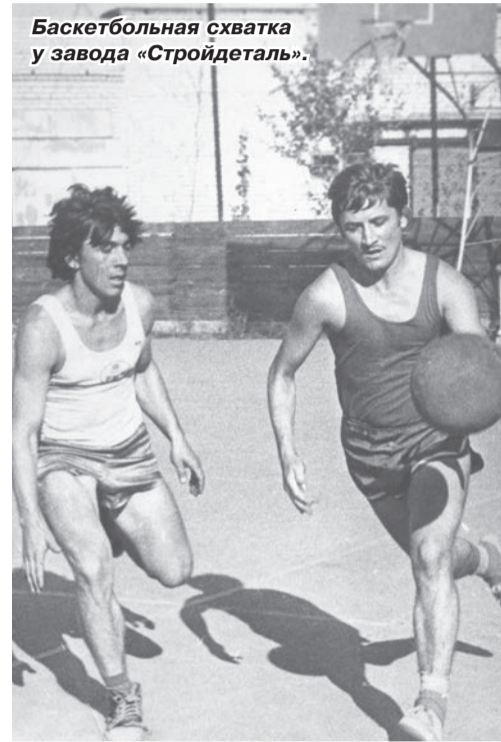
Баскетбольная схватка у завода «Стройдеталь».

пали в Пермь, на финал областных игр и стали первыми. С 1977 года в Чайковском стали ежегодно проводиться финальные игры и другие турниры, так как появились большие спортзалы «Энергия», «Речники», «Чайка».